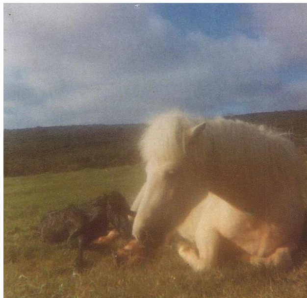
Lýsa og Kráka | 1978

Kráka var fyrsta folaldið sem fæddist hér í Dallandi. Það var 17. júní árið 1978 að Lýsa frá Efri – Rotum (keypt 1975) reyndi ítrekað að stinga okkur, forvitna eigendurna, af til að fá næði við að koma fyrsta afkvæminu sínu í heiminn. Einhverntvegginn tókst okkur þó að koma Lýsu heim á tún í tæka tíð og þar leit Kráka litla dagsins ljós í fyrsta sinn. Nokkrar ljósmyndir tókum við af atburðinum.