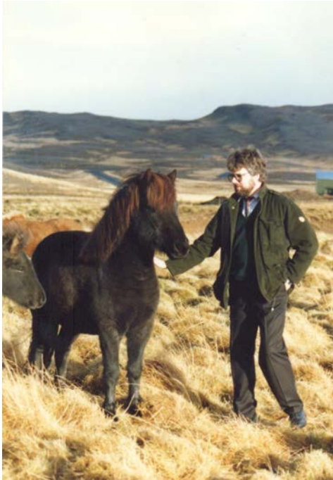
Þeir félagarnir forðum daga.....svo liðu árin

fum eða fát, heldur stóð yfirvegaður, bar höfuðið hátt og horfði yfir svæðið. Pokki var fæddur höfðingi.