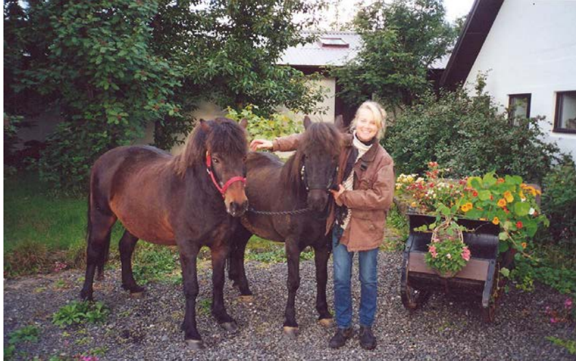
Síðsumar í Dallandi og síðsumarið komið í félagana mína.

Glaumur var stærri hestur og sterkari og tók oft af skarið ef aðrir hestar voru að abbast upp á þá félagana í stóðinu þegar að þeir voru orðnir gamlir og hrumir. Sókron stólaði þá mikið á krafta hans.