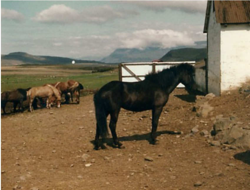
Kráka ung að árum