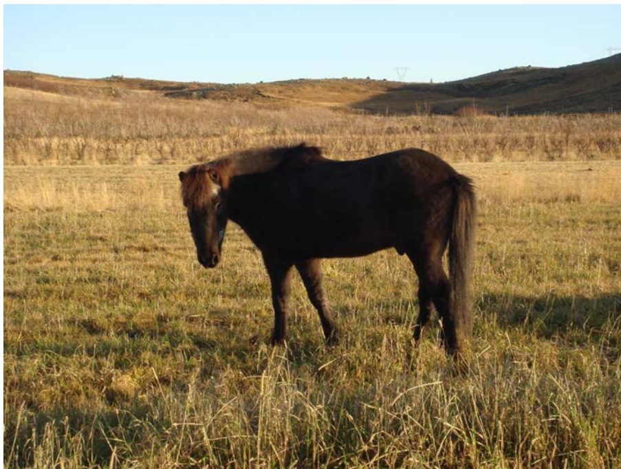
Sókron síðasta haustið

Sókron frá Sunnuhvoli var stórkostlegur hestur um svo margt og því langar mig að deila hér nokkrum minningarbrotum og lýsingum á þessum ógleymanlega félagi mínum. Glaumur hét annar einstakur reiðhestur sem ég átti nær öll Sókronsárin og varla er því hægt að minnst Sókrons, (meðan hann var í minni umsjá )nema Glaumur komi þar eitthvað við sögu . Glaumur var felldur árið 2007 .