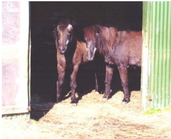
Vinirnir óaðskiljanlegu, Sókron 32 og Kráka 30 vetra skýla sér fyrir sólinni í útigangshúsinu 2008