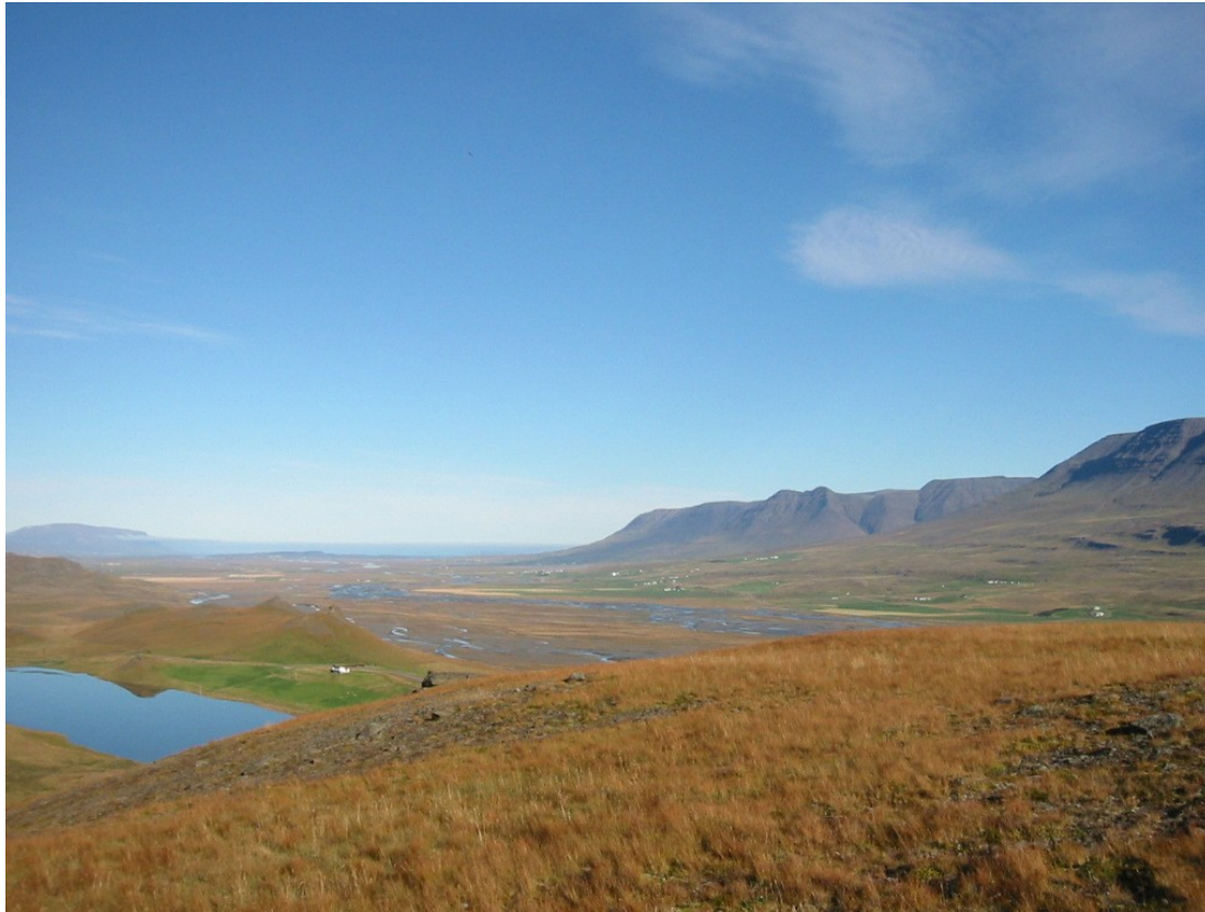
Séð yfir Skagafjörðurinn frá Hellisásnum ofan Stapavatns