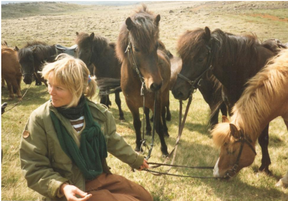
Á leið til Þingvalla með Glaum, Sókron og Nasa frá V- Sámstöðum

„Ég er til í hvað sem er frú mín góð, hvað má ég bjóða þér upp á?“ Þegar hann var hvað kátastur, og við ekki alveg sammála um hve hratt skyldi farið, tók hann stundum af skarið sér til skemmtunar og hoppaði í loft upp á öllum fjórum. Til hvers var verið að silast áfram á þessari lítilmótlegu milliferð sem mældist vart. Hélt svo áfram á milliferðinni að afloknu einu svona gleðihoppi og taldi ábyggilegt að knapinn, oftast ég, hefði ekkert tekið eftir neinu óvanalegu innskoti í annars óbrigðulum ganghæfileikum. Oft brá mér nokkuð við þessi óvæntu skemmtiatriði. Sérstaklega átti þetta við á sumrin, því þá var fjörið og stemningin á mínum alveg á útopnu.