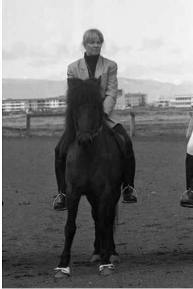
Við Sókron nýbúinn að vinna á vetraruppákomu Fáks.