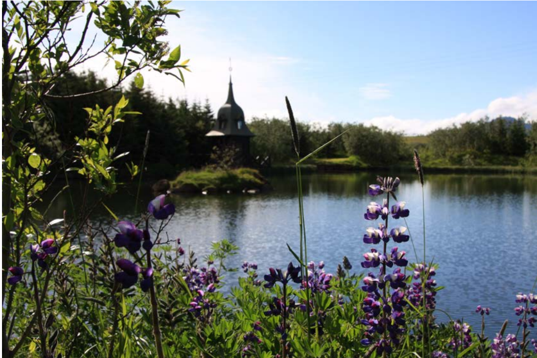
Aftur kemur vor í Dal