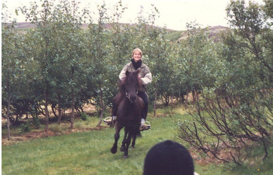
Minn á brunandi ferð