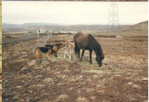
Kráka og Kúnígúnd litla