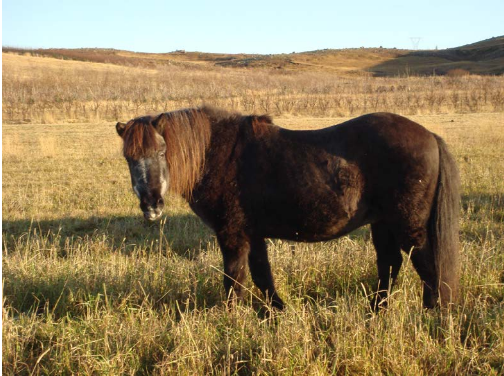
Kráka frá Dallandi 31 vetra í nóvember 2009