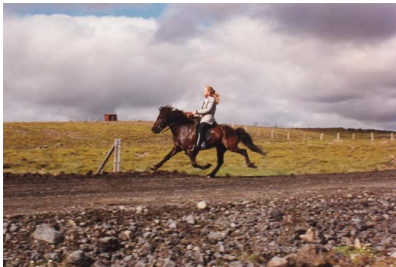
Þegar Spánarkonungur og drottning komu í Dal 1989 voru bæði Sókron og stígvélin mín þússuð .

Keppnisferill Sókrans var sérstakur að því leyti, að hann var alltaf notaður í venjulegri reið í marga mánuði milli þess sem hugmynd kviknaði um að gaman væri að sýna hann aftur. Þá var hann sendur í smá skerpingu, eða þússaður svolítið upp fyrir eitthvað sérstakt mót eða tilefni. Það var eins og hann skildi hvað stæði til því hann varð aðeins montnari með sig enda knaparnir betri knapar en eigandinn. Alltaf var eftirsjá hér á bæ þegar hann var sendur svona í burtu um tíma. Við ímynduðum okkur þó að honum finndist svolítið gaman að spreyta sig og það að fara á skeið er ég alveg viss um að var hans besta skemmtun.