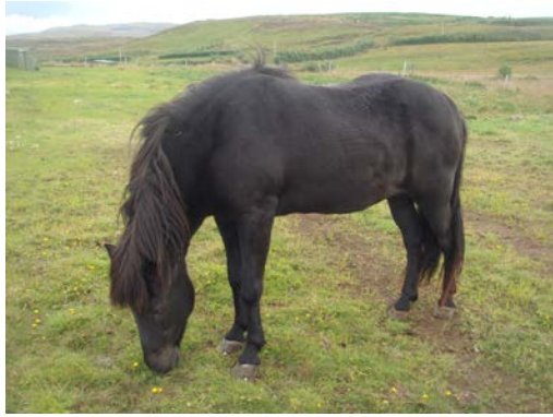
Dúkkulísa 26 vetra, sumarið 2009