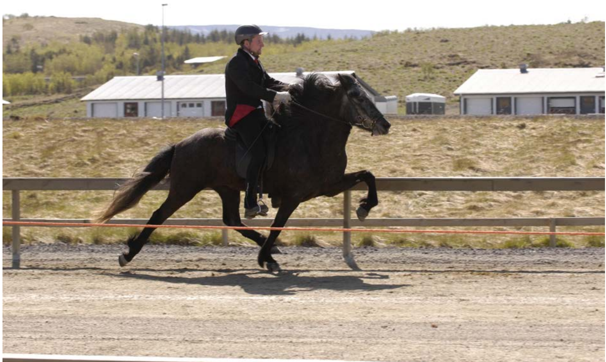
Hríma dóttir Dúkkulísu og Hugins frá Haga fór í hæsta dóm yfir landið í fl. 4.v .hryssna árið 2005